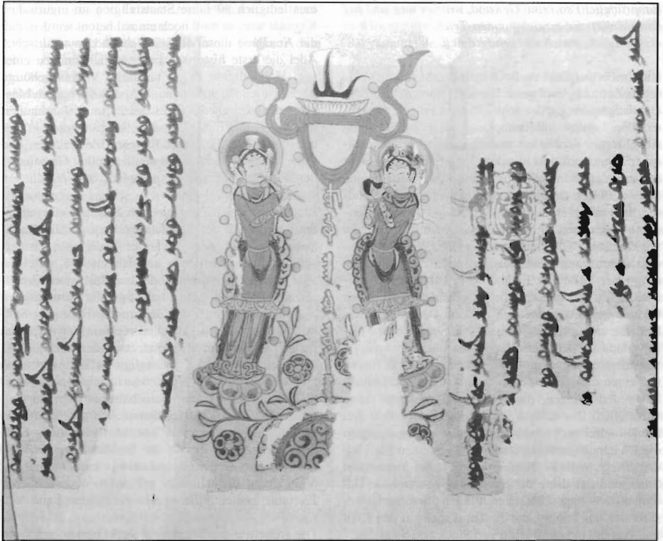
Manichäisch-sogdische Miniaturmalerei, 1981 in Bätzälik bei Turfan gefunden

Er sah (die Leiche) und dachte: »Das ist ja meine Frau!« Er ging hinein und legte sich zu der Leiche. Und wegen seines Rausches und seiner Dummheit umarmte er die Leiche, wurde enthemmt und vereinigte sich sexuell mit ihr. Wegen seiner Gewaltausübung zerplatzte die Leiche. Blut, Eiter, Exkrememente und andere üble Bestandteile ihres ekelhaften Körpers flossen heraus und ergossen sich über ihn. Dieser edle