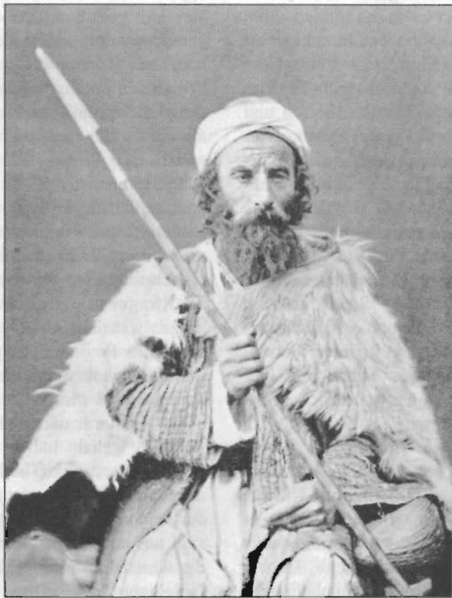
Wanderderwisch, Anfang 20. Jahrhundert

unterhalten lassen: Die Klöster waren ja nur durch Spenden und Almosen der nicht-mönchischen Bevölkerung überlebensfähig. Die buddhistische Interpretation, warum es überhaupt eine Laienbevölkerung gibt, beruht auf dem Prinzip der Wiederverkörperung nach dem Tode, deren Qualität von den Taten und Gedanken in den vorherigen Millionen von Existenzen abhängt. In einem berühmten alttürkischen Text, der vom Zusammentreffen mit Maitreya, dem Buddha der Zukunft (in etwa 600 Millionen Jahren!) berichtet 23 , wird dies eindrucksvoll geschildert. Der Buddha Śākyamuni persönlich lehrt einen Schüler folgendes: