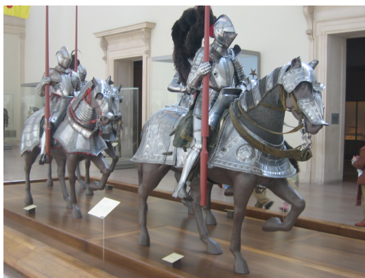
Abb. 8: Mittelalterlicher Harnisch

Originalexponat, um 1400, Metropolitan Museum of Art, New York.