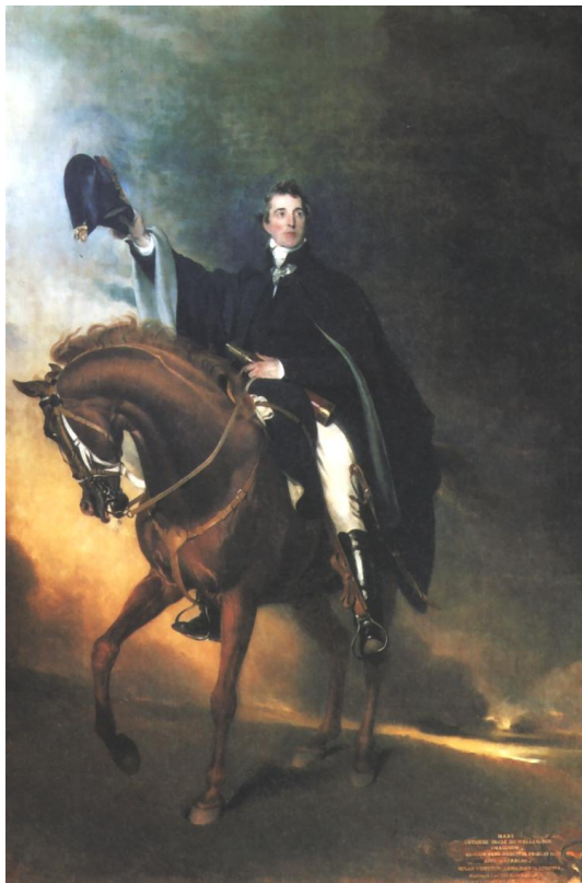
Abb. 17: Thomas Lawrence: „The Duke of Wellington mounted on Copenhagen as of Waterloo“

1818, Öl auf Leinwand, 396,2 cm x 243,8 cm.