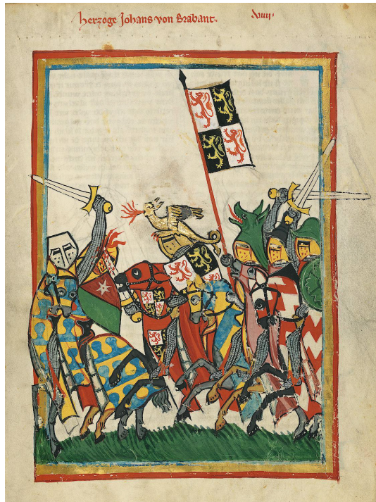
Abb. 4: Darstellung einer Reiterschlacht im Codex Manesse

ca. 1305–1315, UB Heidelberg, Cod. Pal. germ. 848, fol. 18r, Herzog Johann von Brabant (Mitte) in der Schlacht von Worringen.