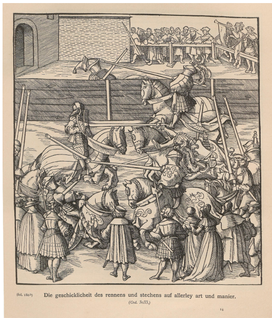
Abb. 9: Illustration aus „Weißkunig“