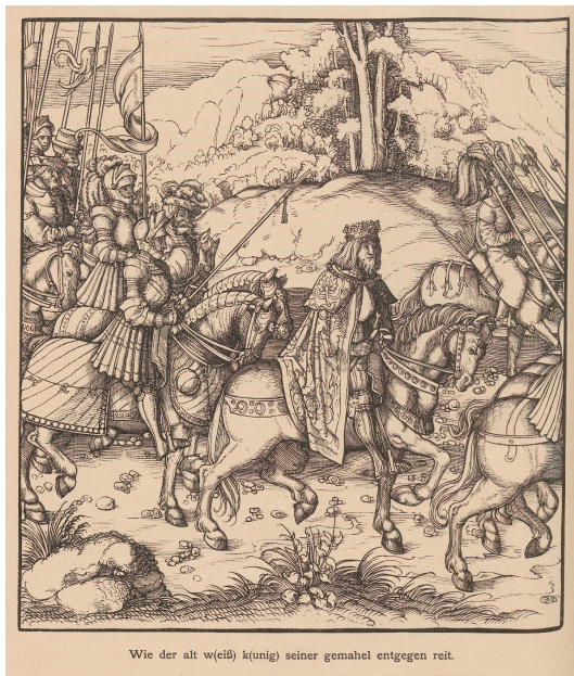
Abb. 11: Illustration aus „Weißkunig“