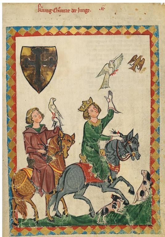
Abb. 5: Darstellung von Reitern im Codex Manesse

ca. 1305–1340, UB Heidelberg, Cod. Pal. germ. 848, fol. 7r, Konradin von Hohenstaufen („König Konradin der Junge“).