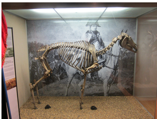
Abb. 18: Das Skelett von Napoleons Pferd Marengo