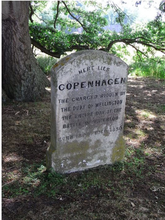
Abb. 19: Grabstein von Copenhagen, dem Pferd des Feldmarschalls Wellington