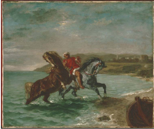
Abb. 30: Eugène Delacroix: „Horses Coming Out of the Sea“

1860, Öl auf Leinwand, 51,4 cm x 61,5 cm, Washington, D.C., Phillips Collection.