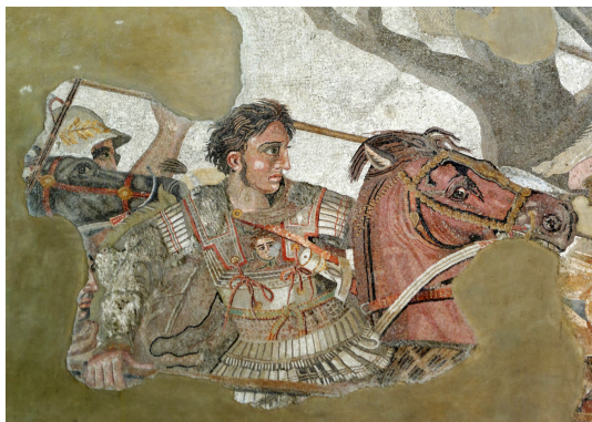
Abb. 1: „Alexanderschlacht“ (Detail)

Kopie des 2. Jhs. v. Chr. nach einem Gemälde des späten 4./frühen 3. Jhs. v. Chr., Mosaik/Stein, Maße 5,13 m x 2,72 m, Neapel, Museo Archeologico Nazionale.