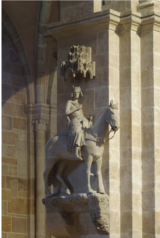
Abb. 6: Bamberger Domreiter

um 1250, Sandstein, Kulturhistorisches Museum Magdeburg.