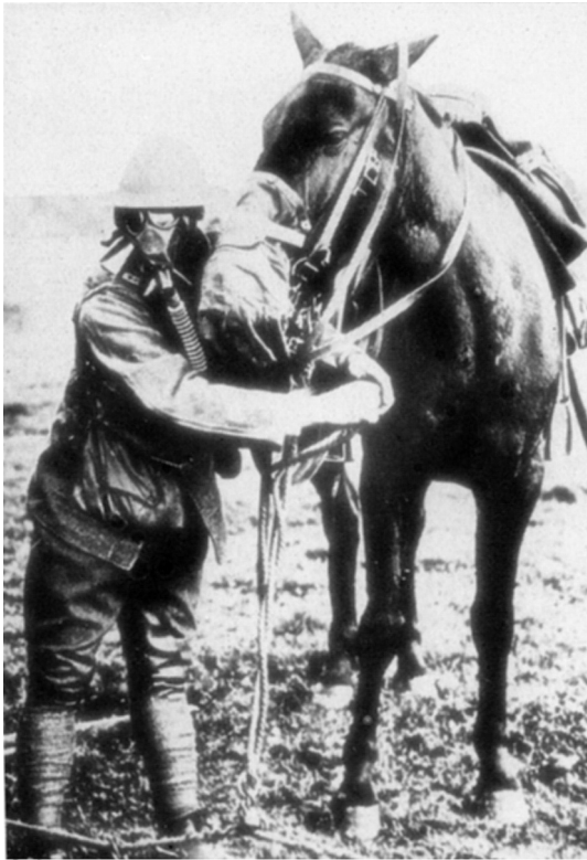
Abb. 20: Pferd mit Gasmaske