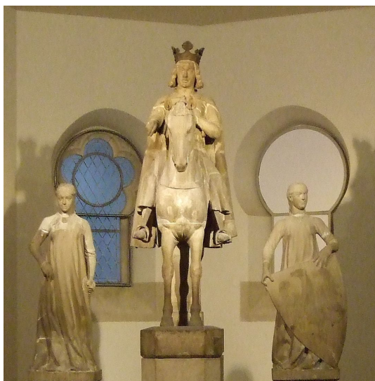
Abb. 7: Magdeburger Reiter mit zwei Begleitern

um 1240, Sandstein, Kulturhistorisches Museum Magdeburg.