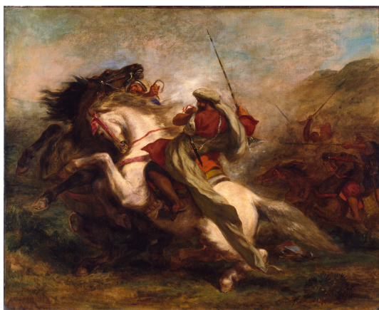
Abb. 29: Eugène Delacroix: „Collision of Moorish Horsemen“

1843/1844, Öl auf Leinwand, 81,3 cm x 99,1 cm, Baltimore, Walters Art Museum, Inv.-Nr. 37.6.