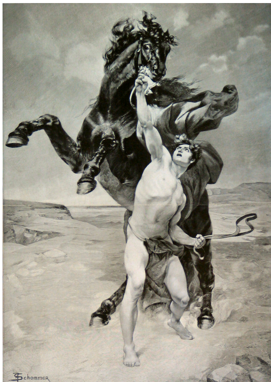
Abb. 2: Francois Schommer: „Alexander und Bukephalos“

Lizenz: Creative Commons BY-SA 3.0 Unported