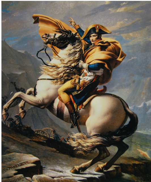
Abb. 28: Jacques-Louis David: „Napoléon Bonaparte überquert den großen Sankt Bernhard“

1801, Öl auf Leinwand, 272 x 232 cm, Malmaison, Musée National du Château