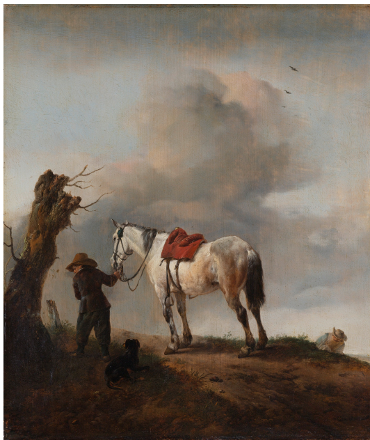
Abb. 25: Philips Wouwerman: „De schimmel“

1646, Öl auf Leinwand, 43,5 cm x 38 cm, Amsterdam, Rijksmuseum, Inv.-Nr. SK-A-1610.