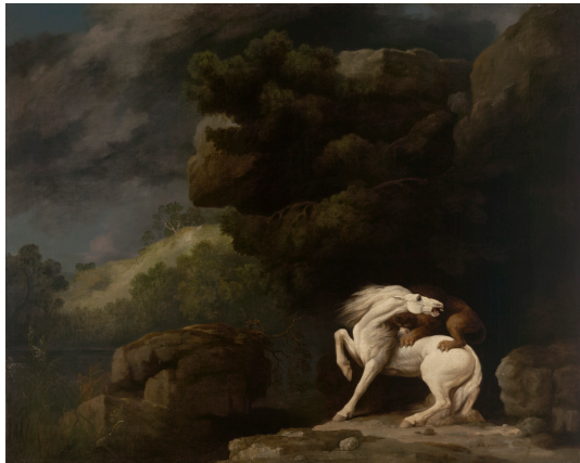
Abb. 27: George Stubbs: „A Lion Attacking a Horse“

1770, Öl auf Leinwand, 101,9 x 127,6 cm, New Haven, Yale University Art Gallery, Inv.-Nr. 1955.27.1