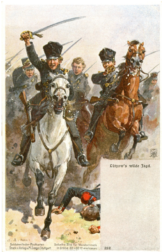
Abb. 13: Soldatenlieder-Postkarte o. J. Beschriftung: „Lützow's wilde Jagd.“ Quelle: Goethezeitportal Lizenz: Nicht-kommerzielle Nutzung gestattet (vgl. Ende der verlinkten Seite)