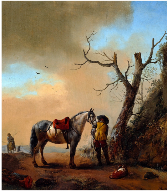
Abb. 26: Philips Wouwerman: „Landschap met schimmel en afgestegen ruiter“

ca. 1647/1648, Öl auf Leinwand, 35,9 × 31,9 cm, Warschauer Königsschloss.