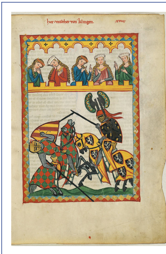
Abb. 3: Darstellung eines Tjosts im Codex Manesse

ca. 1305–1315, UB Heidelberg, Cod. Pal. germ. 848, fol. 52r: Walther von Klingen.