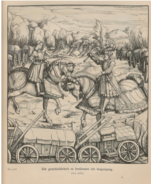
Abb. 10: Illustration aus „Weißkunig“