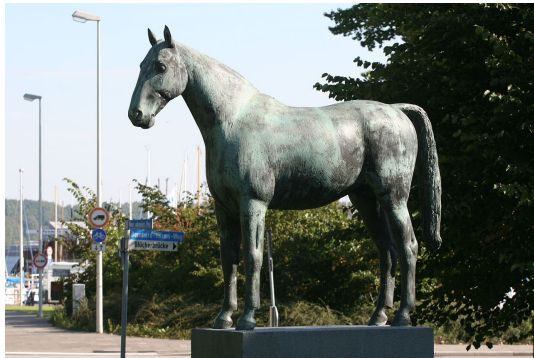
Abb. 23: Hans Kock: „Meteor“