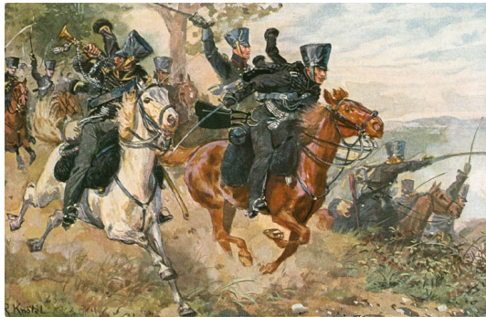
Abb. 12: Richard Knötel: Bildpostkarte „Körner und die Lützower Jäger“

um 1890. Beschriftung verso: „Verein für das Deutschtum im Ausland.“