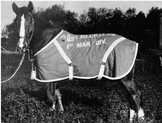
Abb. 21: Das Artilleriepferd Sergeant Reckless